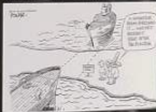
Senator Helms was strongly opposed to giving control of the Panama Canal to Panama.