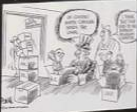
In 1987, Senator Helms became the ranking member of the Senate Foreign Relations Committee.