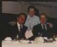
Senator Helms, Dorothy Helms, and Senator Helms' daughter at an event for Senator Helms' 1974 Presidential campaign.